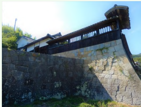
青木石の石垣と日本遺産の 構成文化財「尾上邸」