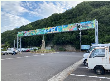
讃岐広島 江の浦港